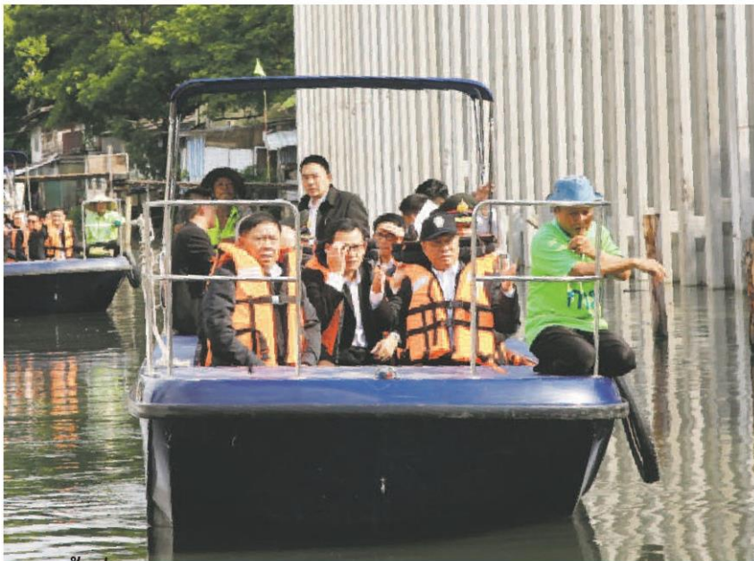
■ ลงพื้นที่ ■ พล.อ.อนุพงษ์ เผ่าจินดา รัฐมนตรีว่าการกระทรวงมหาดไทย และ พล.ต.อ.อัศวิน ขวัญเมือง ผู้ว่าฯ กทม. ลงพื้นที่ตรวจความคืบหน้าโครงการก่อสร้างเขื่อนคลองเปรมประชากร จากถนนเทศบาลสงเคราะห์ถึงสุดเขตกรุงเทพมหานคร เมื่อวันที่ 14 มิ.ย.

พรรคร่วมยื่นชื่อ กรม. ให้สิทธิขาด "บิกตู" บางตำแหน่งมีตัวเลือกเพิ่ม ปชป.ถกเครียด 7 แก๊ง "วิษณุ" รับผิดชอบคุณสมบัติต้องใช้เวลา "บิกตู" คาใจมพพานไหว้ครูล่อ คสช.มีเบื้องหลัง ด้าน "คริสสุวรรณ" ยื่น กทต.สอบ 16 ส.ส.ทันสื่อ อ่านต่อหน้า 8