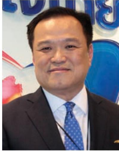
อนุทิน ชาญวีรกูล