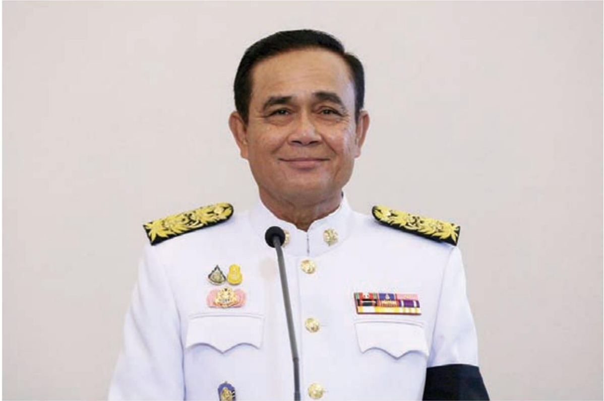
พล.อ.ประยุทธ์ จันทร์โอชา